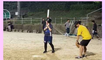
元気いっぱい女子まで