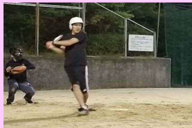
第六支部メンバーは、本格派から

7月4日に鴻ノ巣グラウンドにて、10月開催予定の本部親睦ソフトボール大会に向けた実践形式の練習を実施しました。 総勢37名の参加で楽しい雰囲気の中、随所に活気溢れるプレーも見られました。