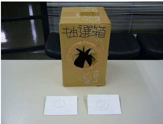
① 応募数 2