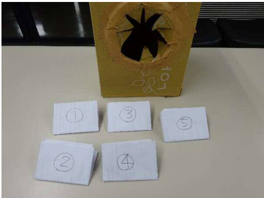
① 応募数 5