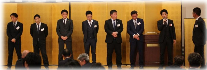
各支部の青年部長がご挨拶をされました。