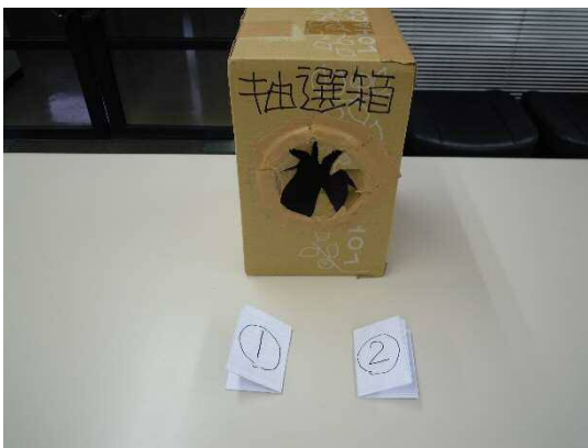
① 応募数 2