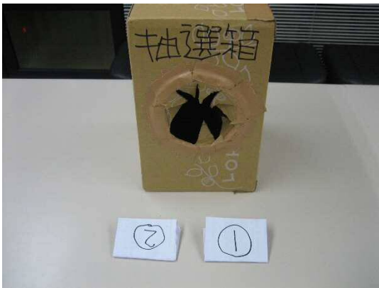
① 応募数 2