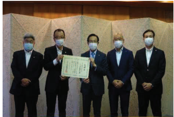
7月2日 京都府知事から感謝状