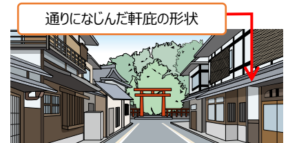
<参道等の眺めの基準のイメージ>

上記①(1) 下線 の寺社等（ 23 箇所）で、「境内地周辺の眺め」として、寺社等の周辺の道路等も視点場に指定します。