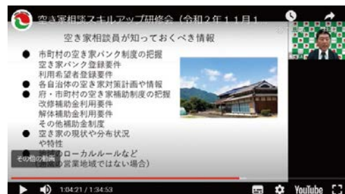
Web研修(空き家相談窓口の現状と相談員の役割)

そのため、京都宅建は会員及びその従業員を対象に、空き家に関する基礎知識、空き家相談の基本や留意点等について学んでいただく「スキルアップ研修」を実施しています。今年度は、コロナ対策としてオンラインでの開催とし、後日、協会ホームページ上での動画視聴もできるようにし、空き家相談員として活躍していただける人材の育成を図りました。