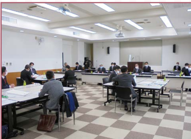
現地調査の前に、調査内容を入念に確認