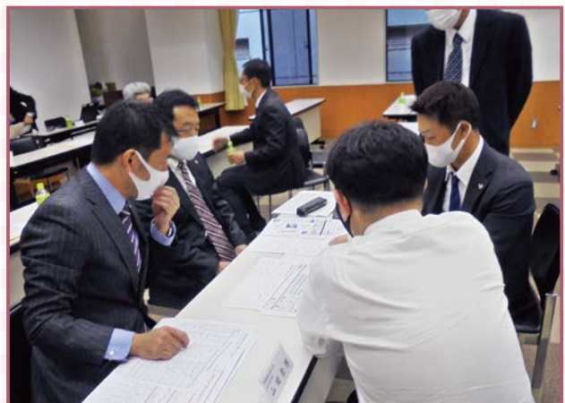
現地調査を基に報告書を作成