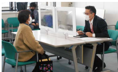
宇治市の相談会の様子

今後も多くの市町との連携を進め、空き家相談会を契機として具体的な空き家の利活用に繋がるよう、協力していきます。